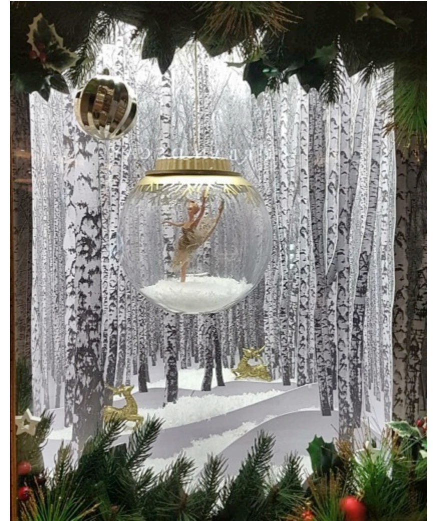
Vitrina Navidad Casa Barros - Costanera Center Diseño, producción y montaje colaboración con Rojo Diseño