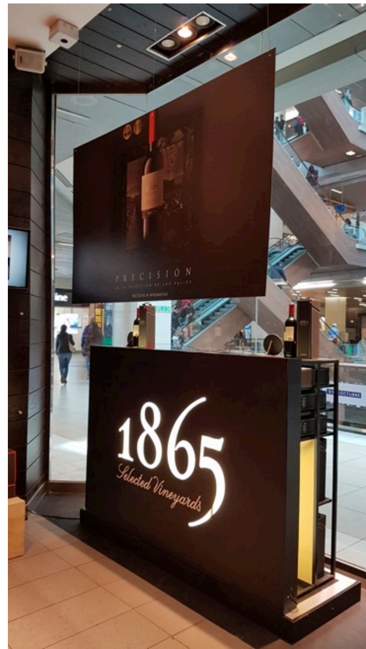
Vitrina 1865 para Mundo del Vino Diseño, producción y montaje colaboración con Rojo Diseño