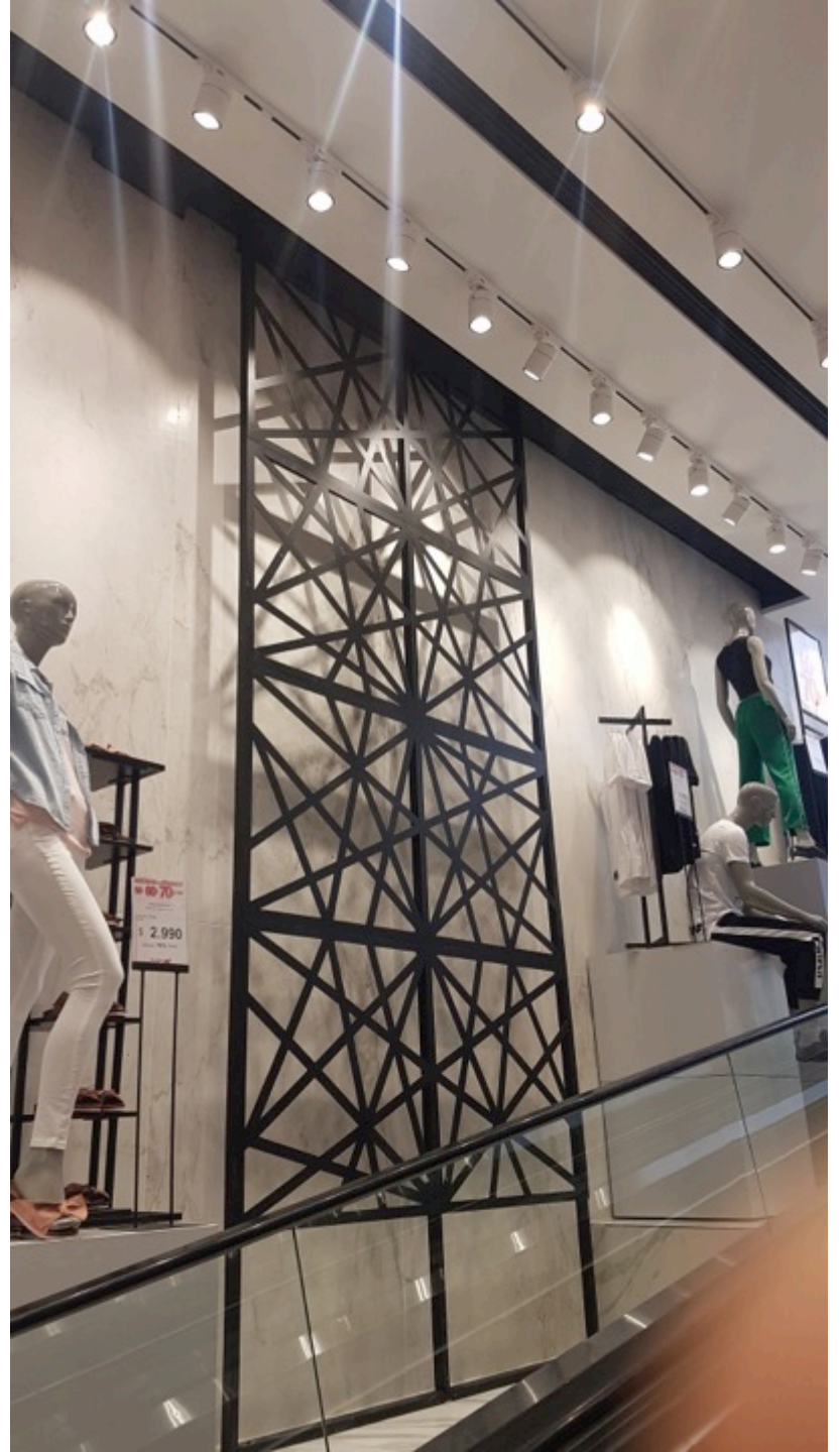
Escalera acceso - Tricot Ahumada Diseño, producción y montaje colaboración con Vitrinas now