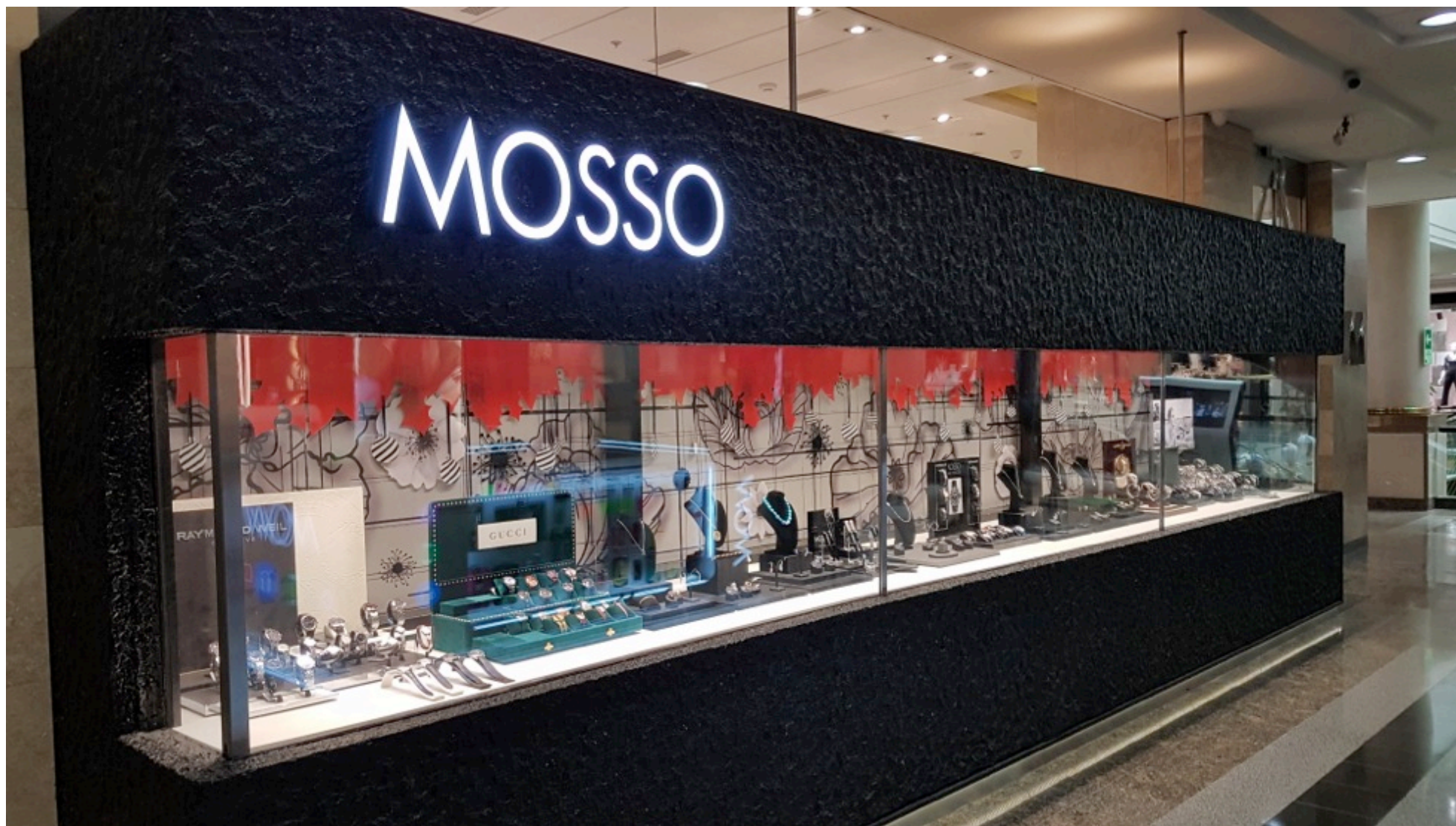
Vitrina Navidad - Mosso

Diseño, producción y montaje colaboración con Rojo Diseño