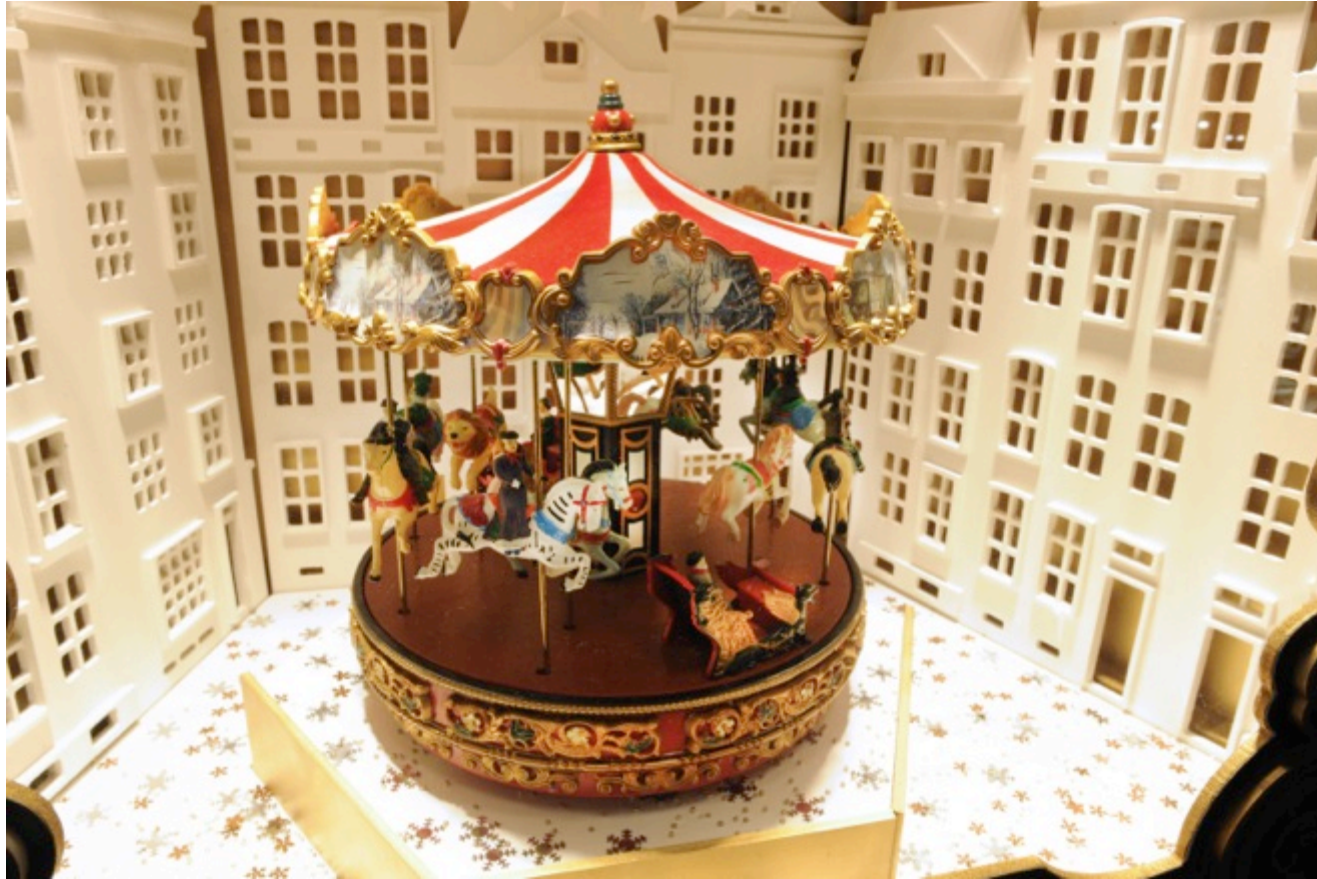
Vitrina Navidad Casa Barros - Alto las Condes Diseño, producción y montaje colaboración con Rojo Diseño