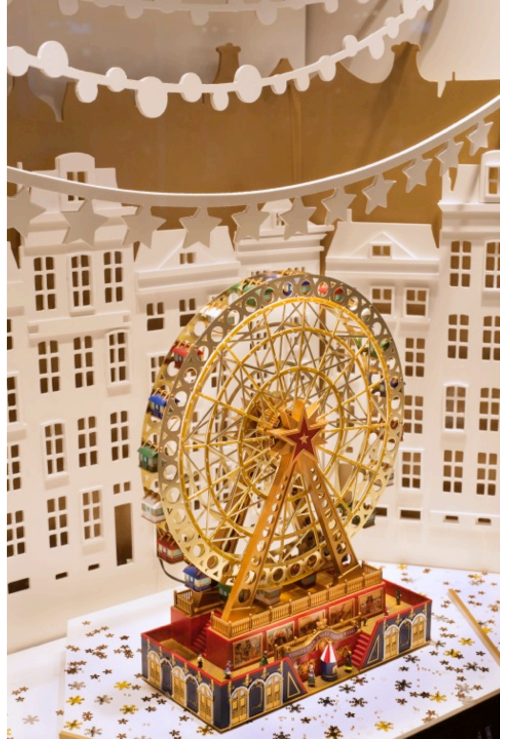
Vitrina Navidad Casa Barros - Parque Arauco Diseño, producción y montaje colaboración con Rojo Diseño