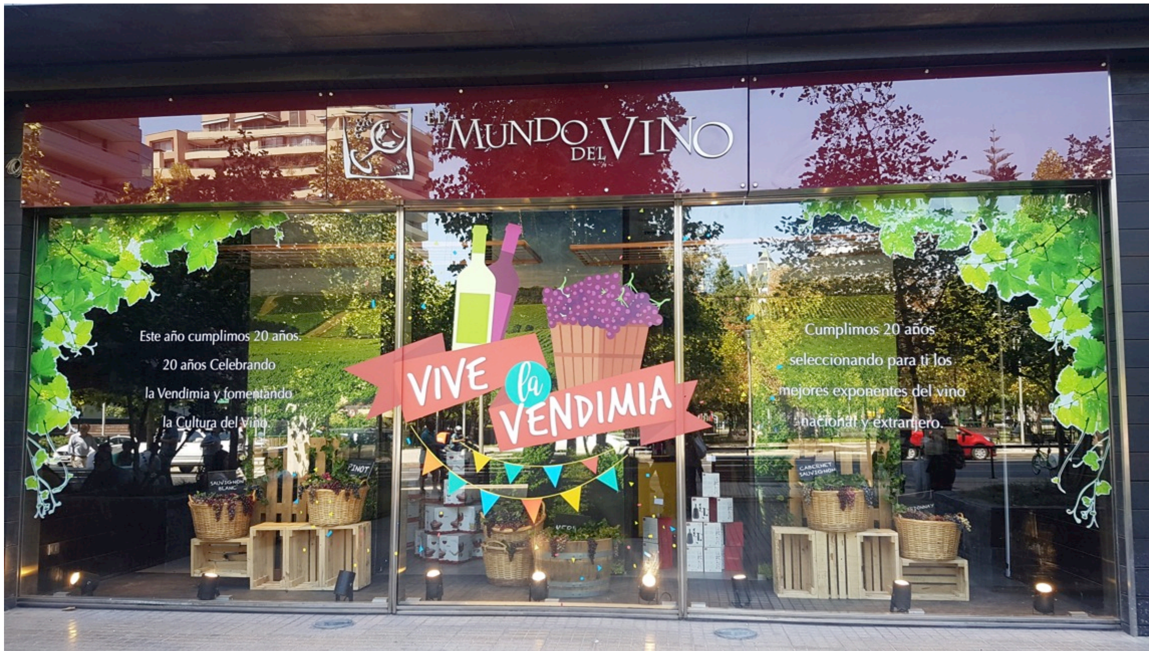
Vitrina Mundo del Vino Decoración Montaje