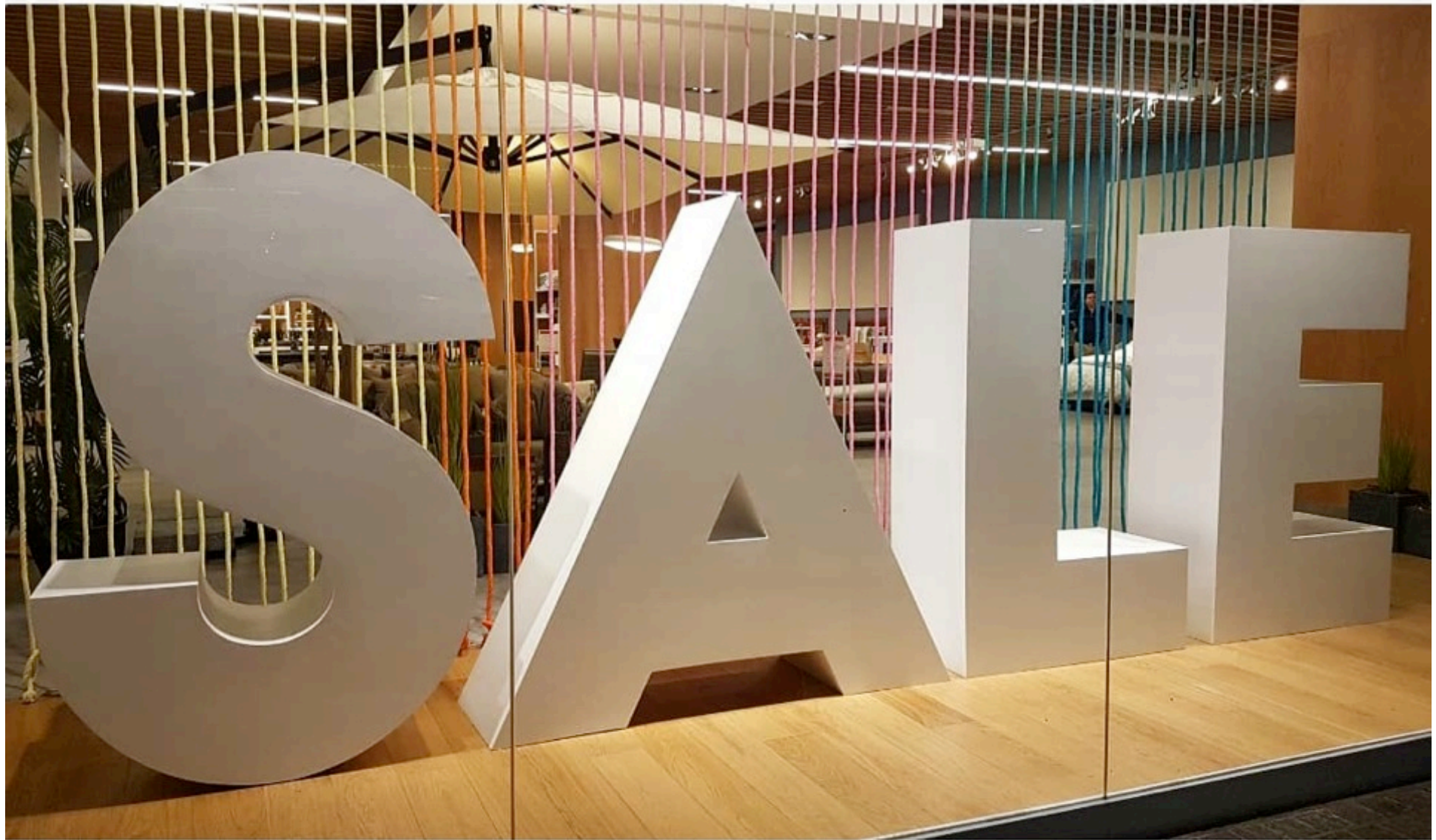
Vitrina Rosen Parque Arauco