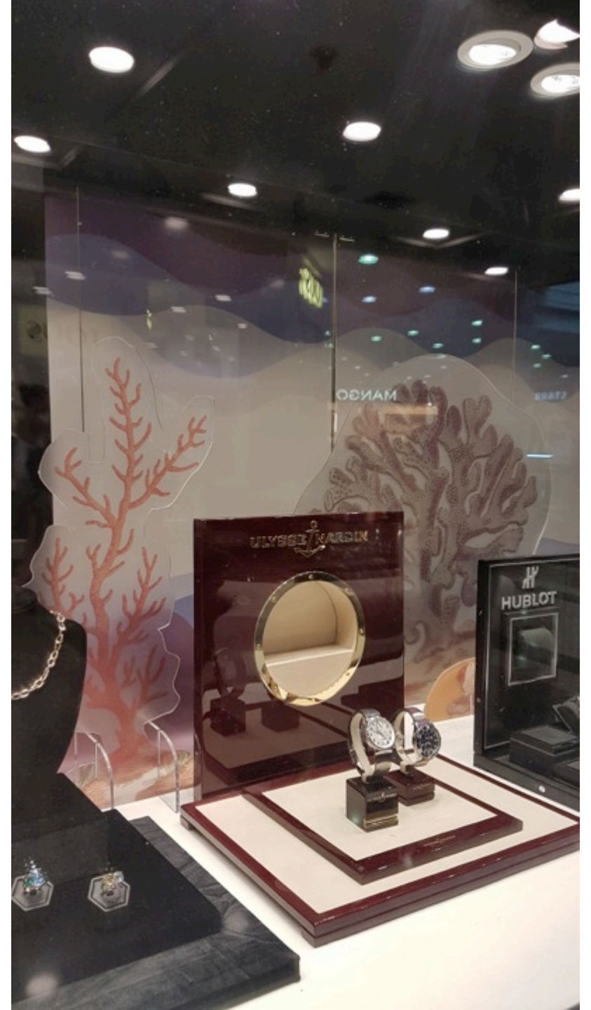
Vitrina Mosso Diseño, producción y montaje colaboración con Rojo Diseño