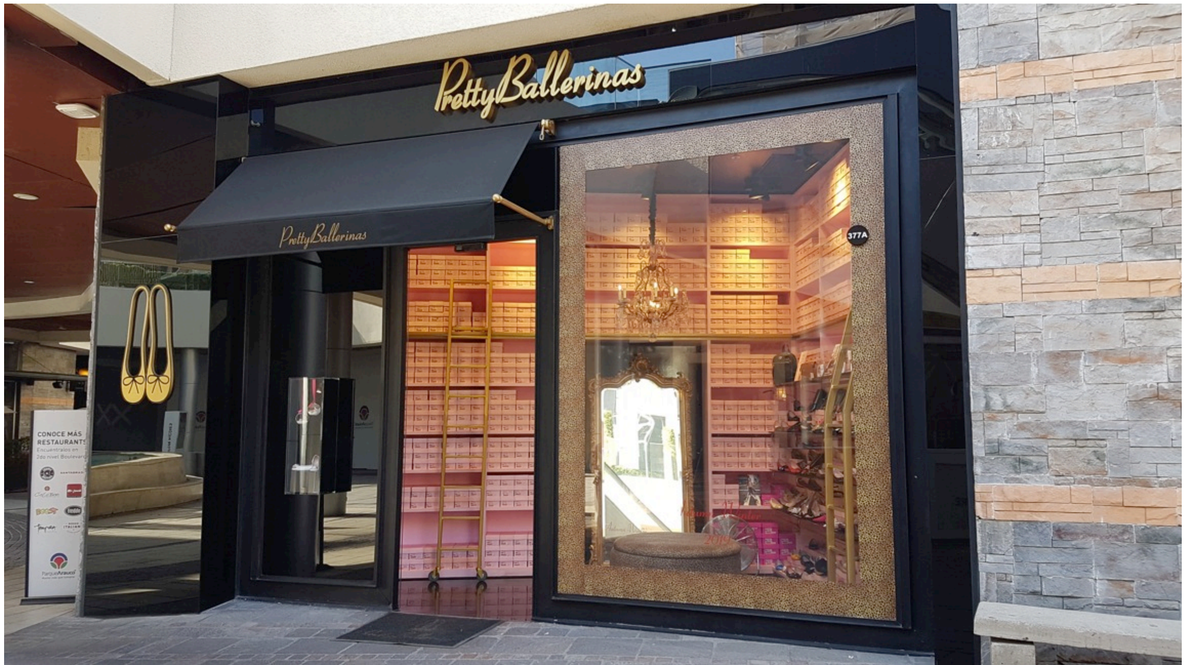
Vitrina Pretty Ballerinas