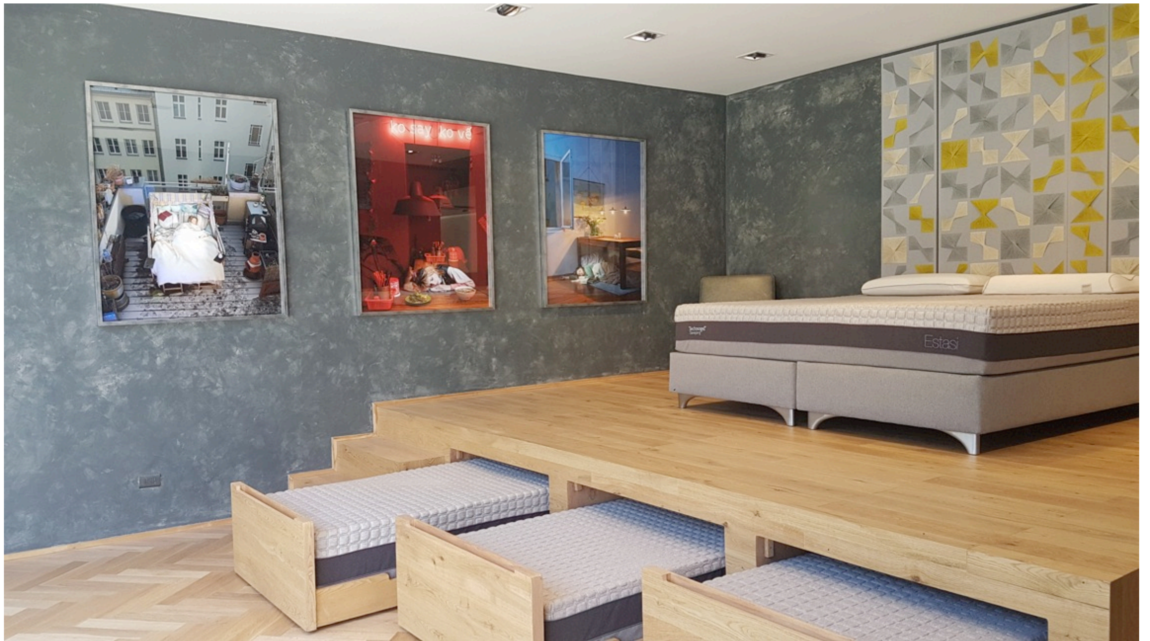
Rosen Corner VIVE Tecnogel