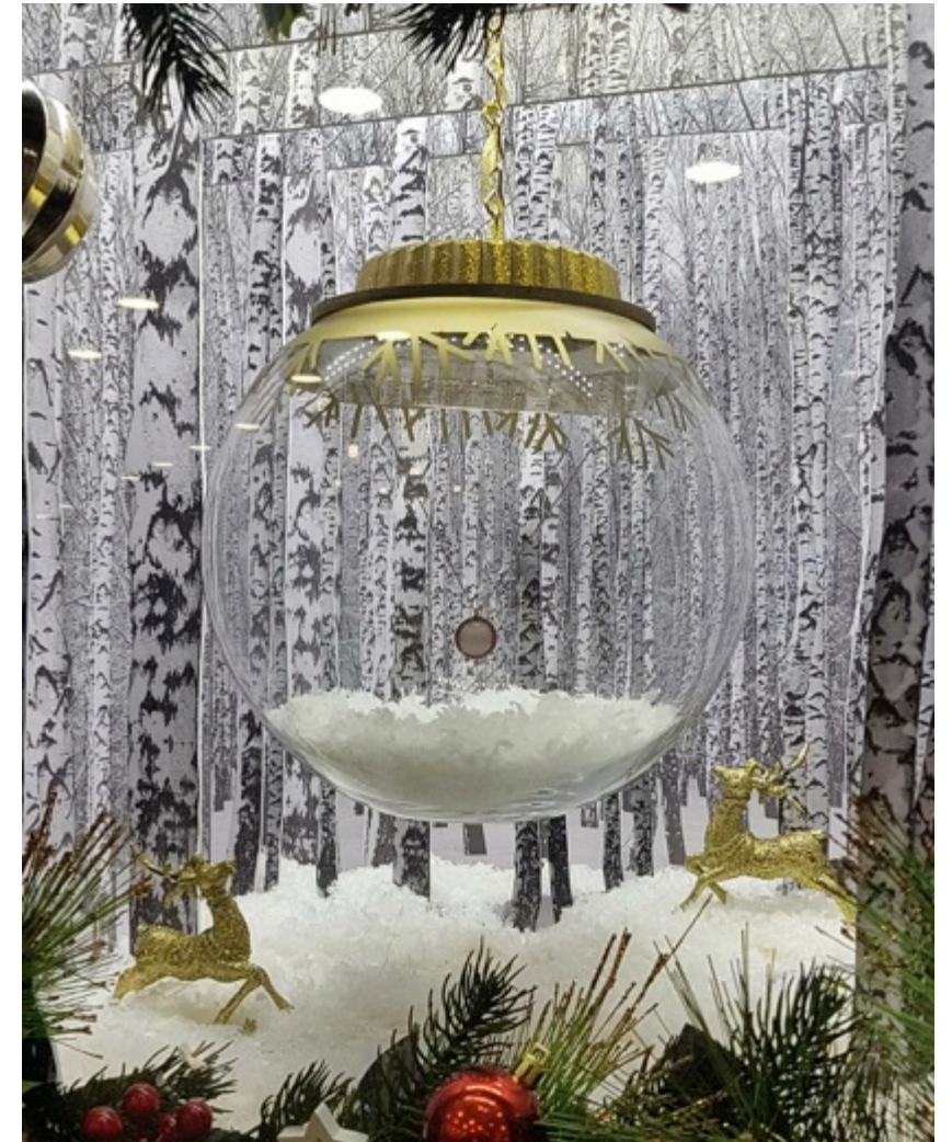
Vitrina Navidad Casa Barros - Parque Arauco Diseño, producción y montaje colaboración con Rojo Diseño