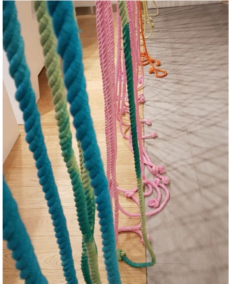
Vitrina Rosen Parque Arauco