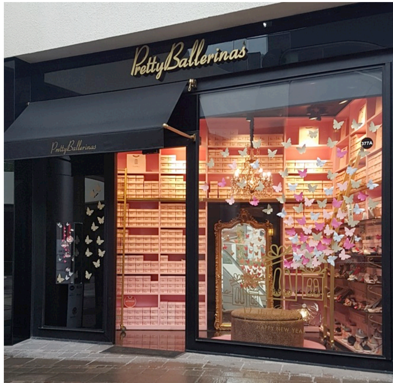
Vitrina Navidad Pretty Ballerinas Parque Arauco